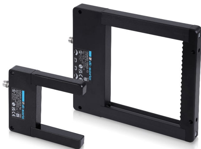
Bild 1: di-soric Rahmenlichtschranken eignen sich ideal für Zählvorgänge und zur Bereichserkennung. Die hohe Auflösung und ultraschnelle Reaktionszeit ermöglichen prozesssichere Lösungen.